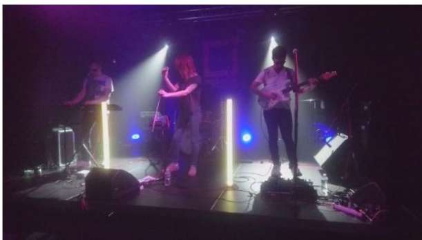
Le trio orléanais Maelzel a subjugué le public avec sa musique onirique.

Depuis 2018 - Diffusion Artefaktor Radio (Web Radio Mexico)